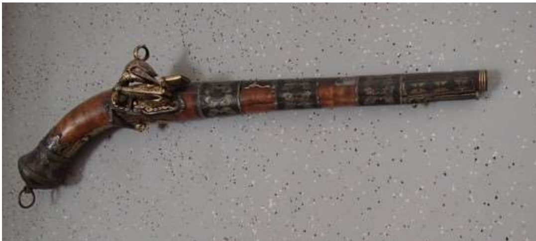
Bild. Ryttarpistol, troligen hemförd av Knut Filip.

Denna pistol på vår hallvägg kom rimligen via Xerxes . Den är troligen från 1600-talets Persien.