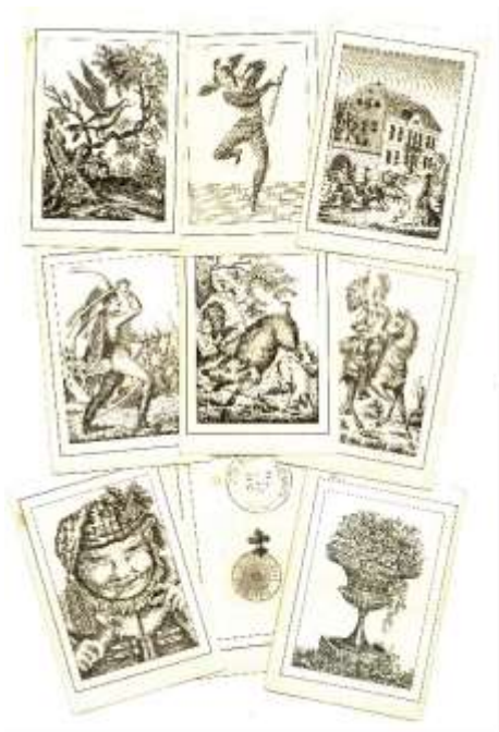
Bild. Spelkort för Kille . Här syns honnörerna Gucku, Harlekin, Vårdshus (med spelutropet ”vårdshus förbi!”), Husar, Vildsvinet (”svinhugg går igen!”), Kavall, samt slankorna ”Blaren” och blompottan.