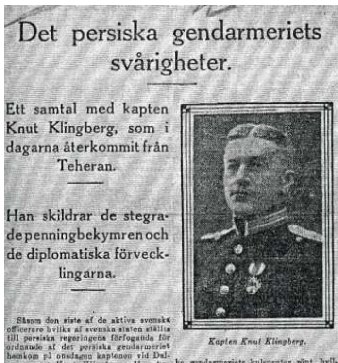
SvD, 1915. Ur Allan R. Ugglas arkiv i Krigsarkivet.