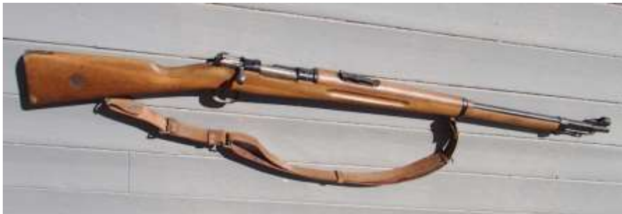
Bild. Mitt Mausergevär m/96, som var standardgevär i svenska armén ända fram till 1960-talet. Enligt bilderna i Täbriz-muséet var revolutionärerna utrustade med samma gevär redan 1906 – 1907.

I Täbriz finns ett museum över den ”konstitutionella revolutionen”. Där noterade jag med förvåning att på foton av revolutionärerna hade de flesta tyska Mausergevär. Jag lärde prickskytte vid 14-års ålder på vår Mauser m/96. Mausern var modern vid revolutionen 1906. Hur har de kommit från Tyskland till Persien, med tanke på att Ryssland och England dominerade Persien redan då? Låg Tyskland bakom revolutionen och därmed uppfattades fiendlig av Ryssland och England? I så fall måste revolutionen krossas. Det är min hypotes.