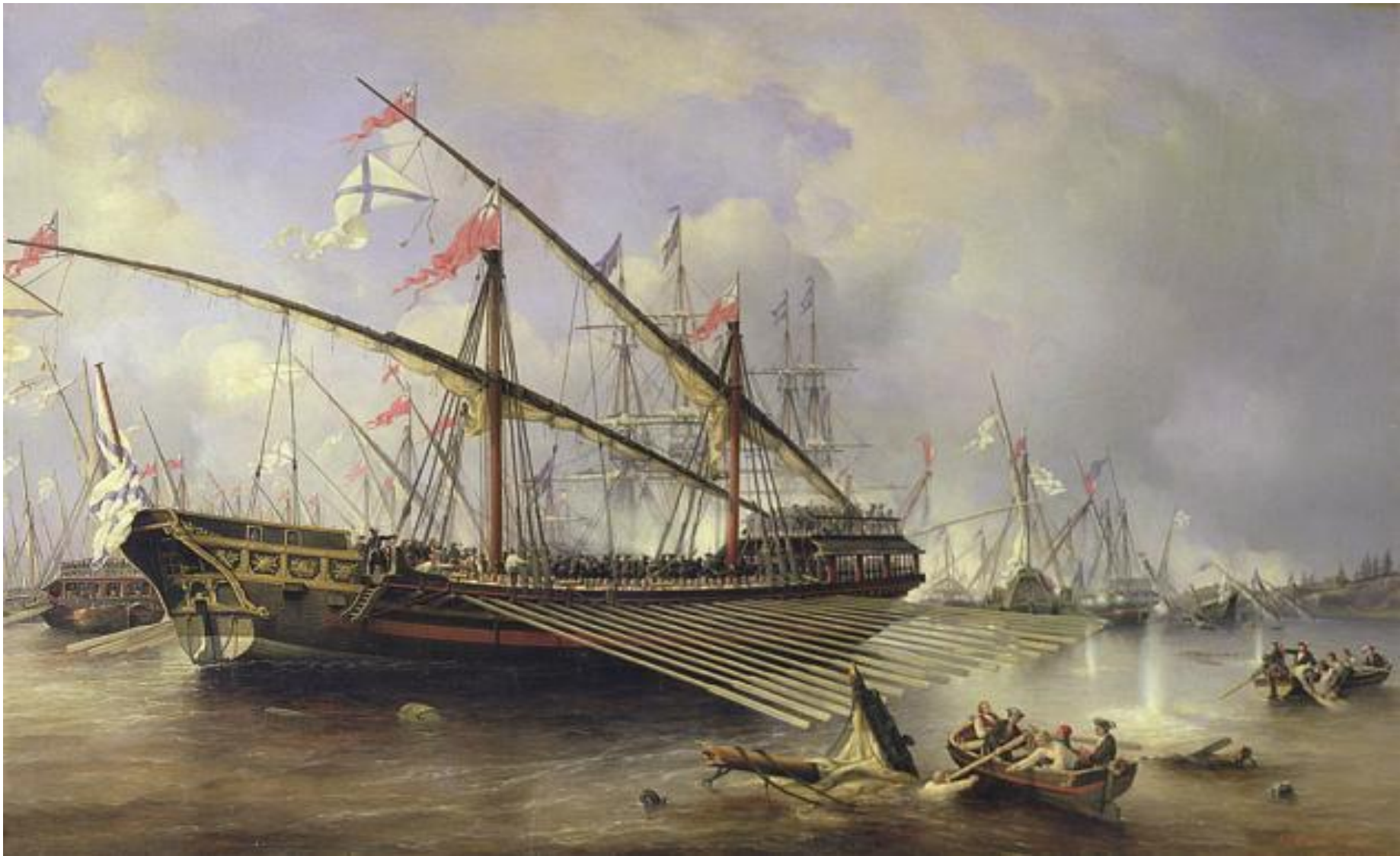
Ryska Galärer utanför Upplandskusten sommaren 1719