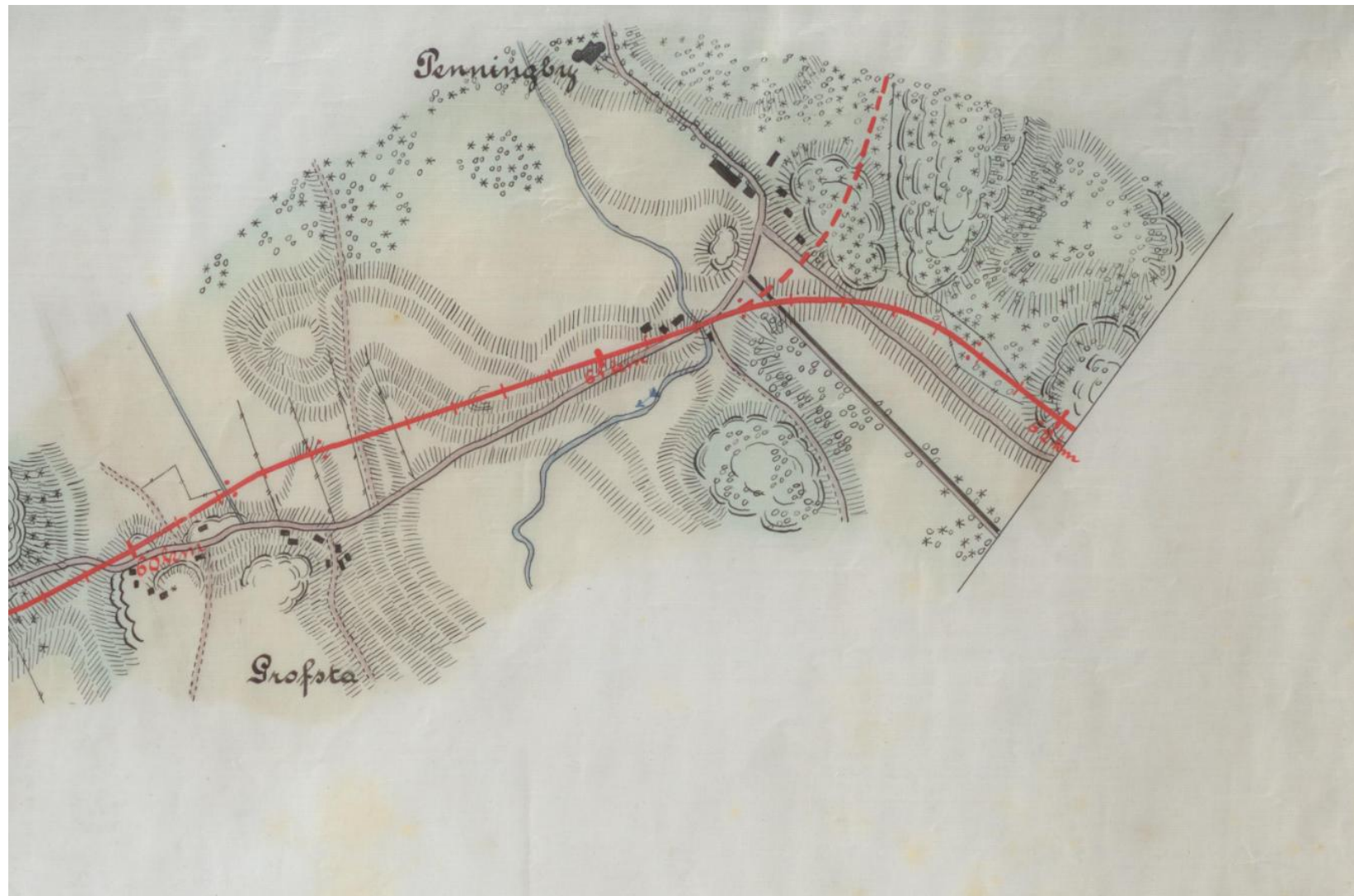
Kapelskärsbanan – karta från 1898