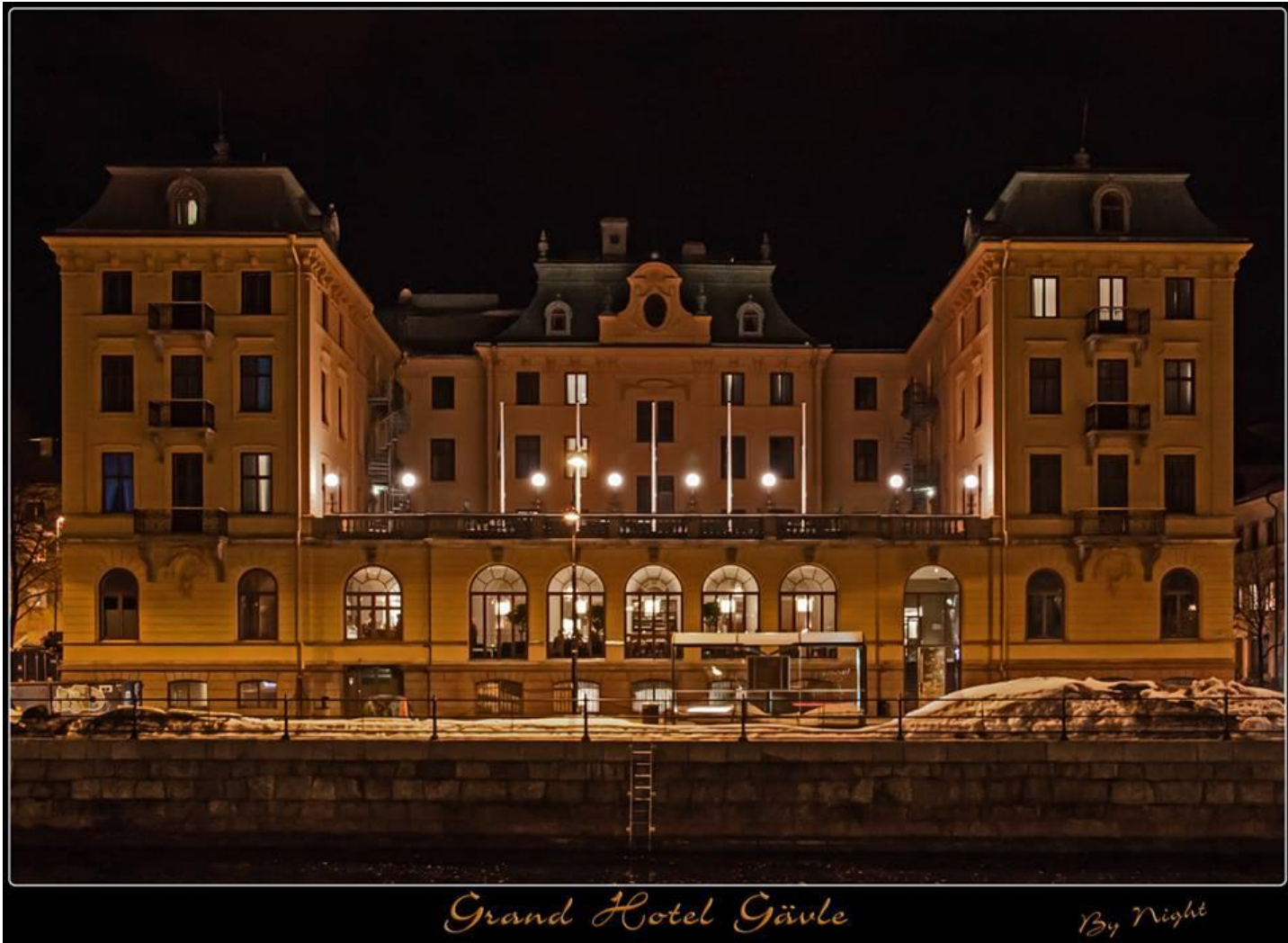
Grand Hotell – Gävle invigt till Gävleutställningen 1901. Byggt av Sten Nordström för Gefle Stad.