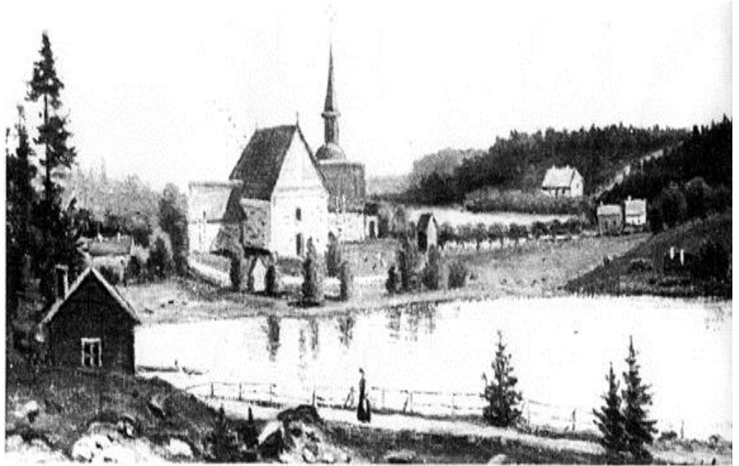
Frötuna Kyrka 1840

Student 1813; Magister 1818. Prästvigd 18210611. Vice Gymnasii Adjunct i Stockholm 18210925. Theol. Cand. i Upsala 18230312. Vice Theol. Et Graecae Linguae Lector vid Stockholms Gymnasium 18230505. Ord. Theol. Lector 18280503 med förbindelse att tillika bestrida Grek. Lectionen. Praes. för Past.Ex. 1829. Kyrkoherde i Frötuna, Stockholms län 18351028. Vice Contr.Prost 1838. Ord. Contr.Prost 18390309. Teol. dr 18441015. Promoverad 18450614. Kyrkoherde i Gävle 18500406, samt "inspector scholae i Gävle". Kontraktsprost i Gästriklands Östra Kontrakt 18500722-1862. Riksdagsman 1850-51, 1853-54, 1859-60. Ledamot av lasarettsdirektionen i Norrtälje 1843 Ledamot av Svenska fornskr.sällsk. 1844. Ledamot av Samf. pro fide et christian 1851. Ledamot av lasarettsdirektionen i Gävle 1852. Ledamot av K.N.O. 18530428. Kommendör av K.W.O.