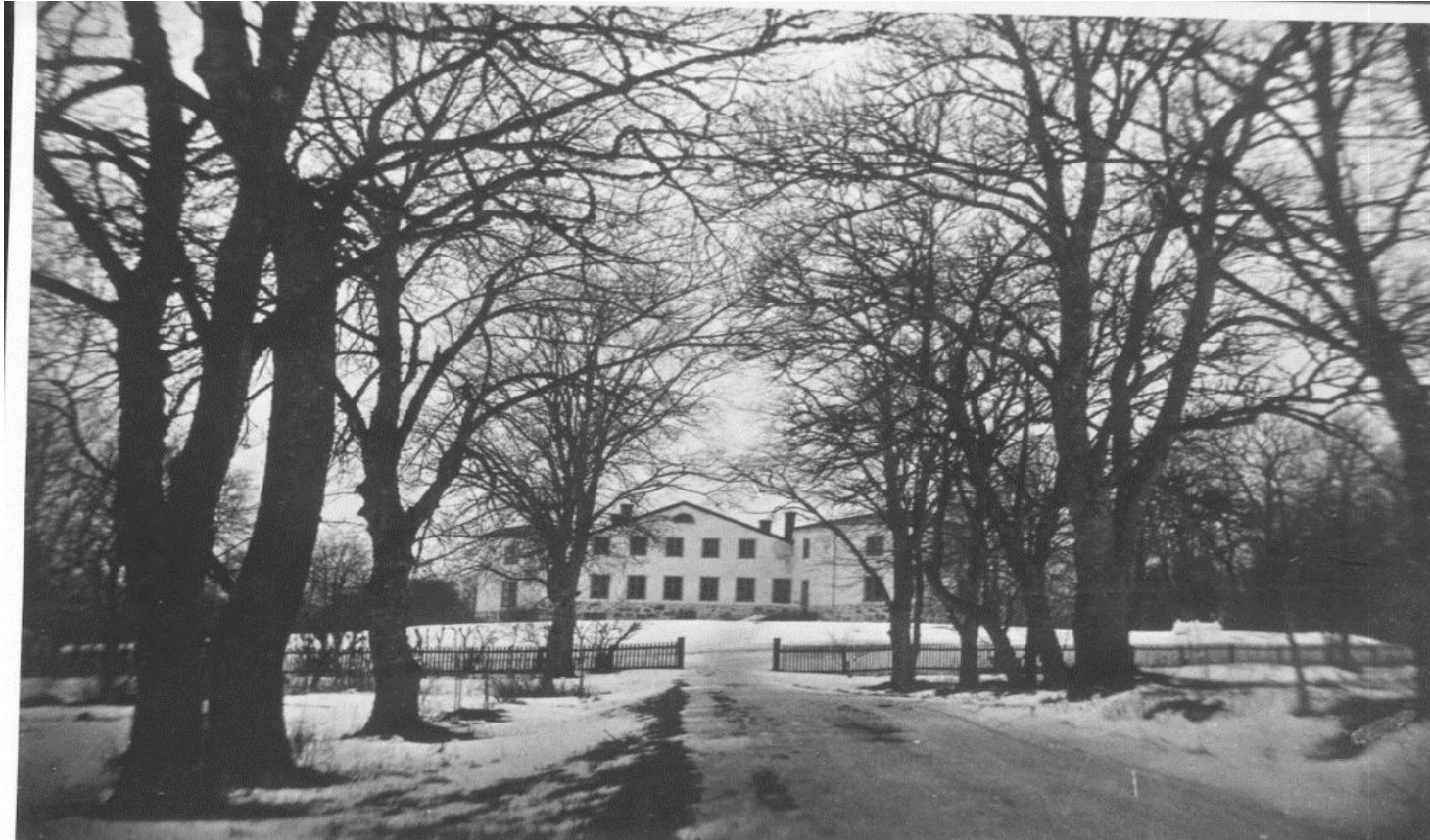
Penningby Slott 1870.