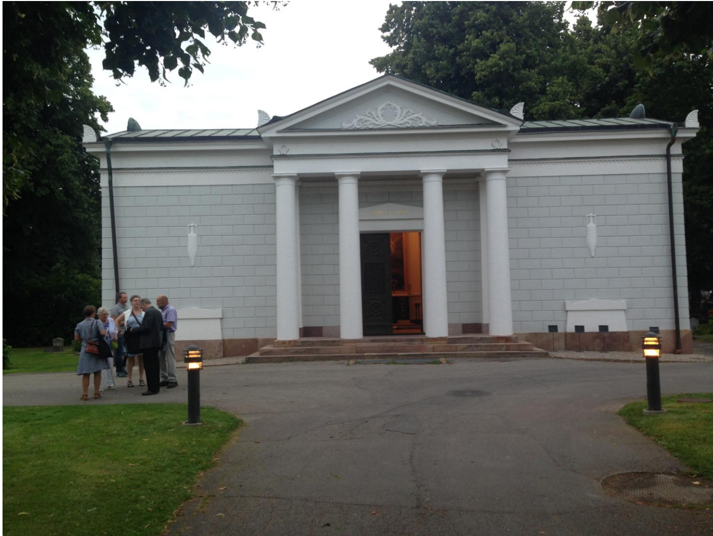
Elfbrinkska Gravkoret i Gävle