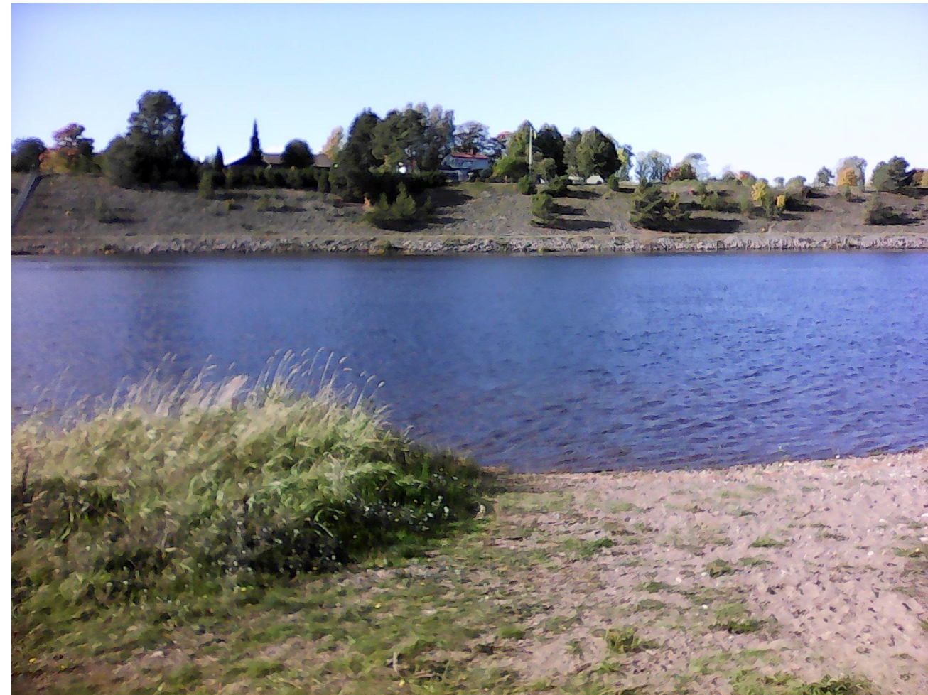
Västana – Älvkarleby