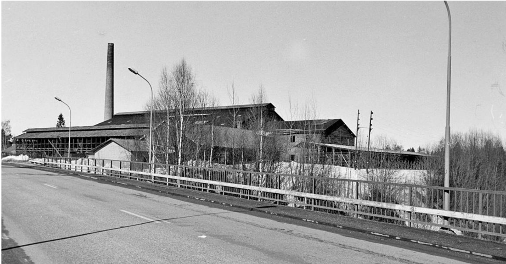
Hagströms Tegelbruk – Gävle – rivet på 1970-talet